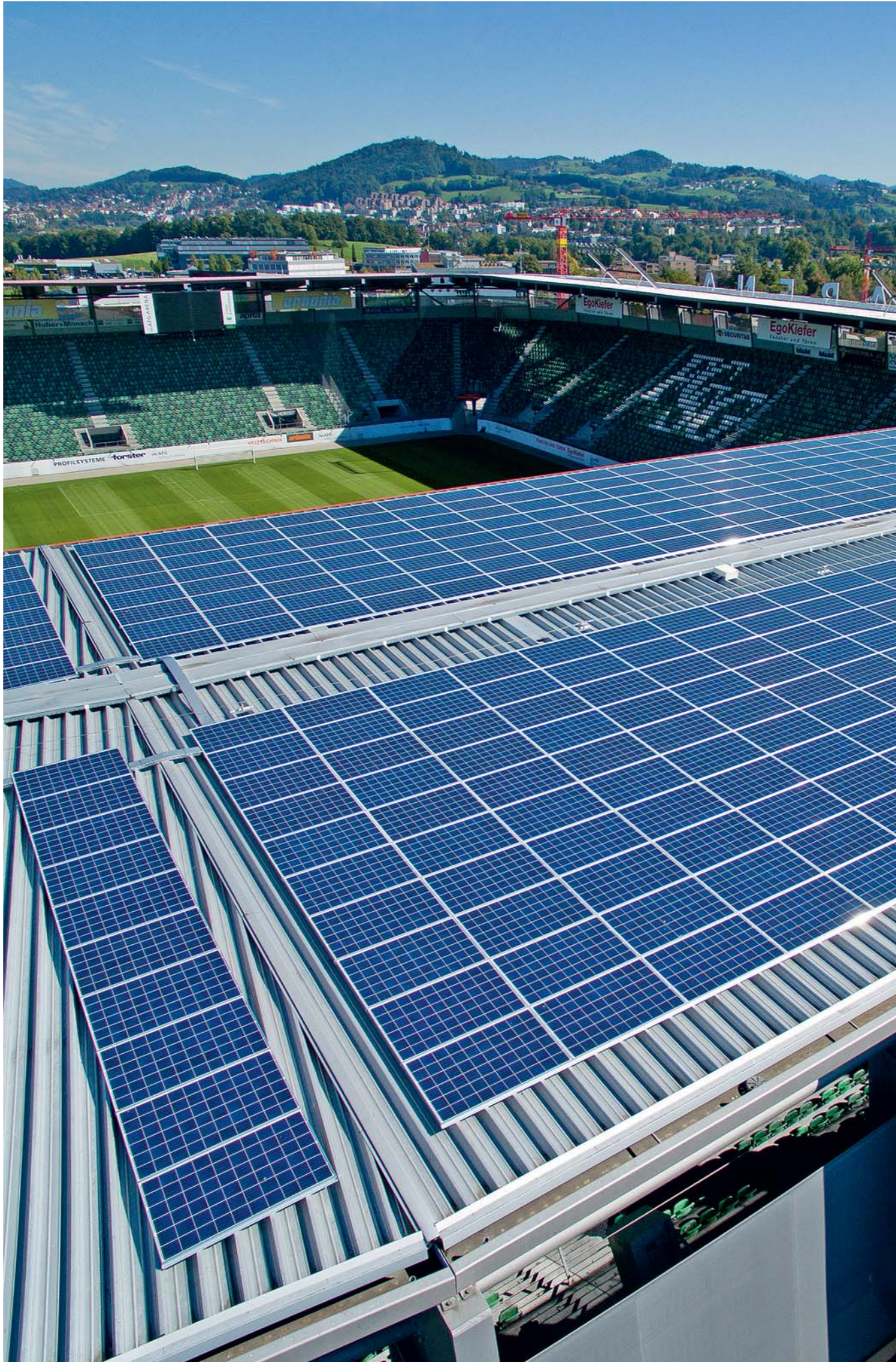
Ein Stadion unter Spannung: die Fotovoltaikanlage auf dem Dach der AFG-Arena.

Mit dem Ausbau der Solarstromproduktion im Jahr 2015 haben die Sankt Galler Stadtwerke den ökologischen Umbau der Energieversorgung weiter vorangetrieben. Um die Effizienz zu steigern, wurden unter anderem Arealnetze saniert und eine weitere dynamische Strassenbeleuchtung installiert.