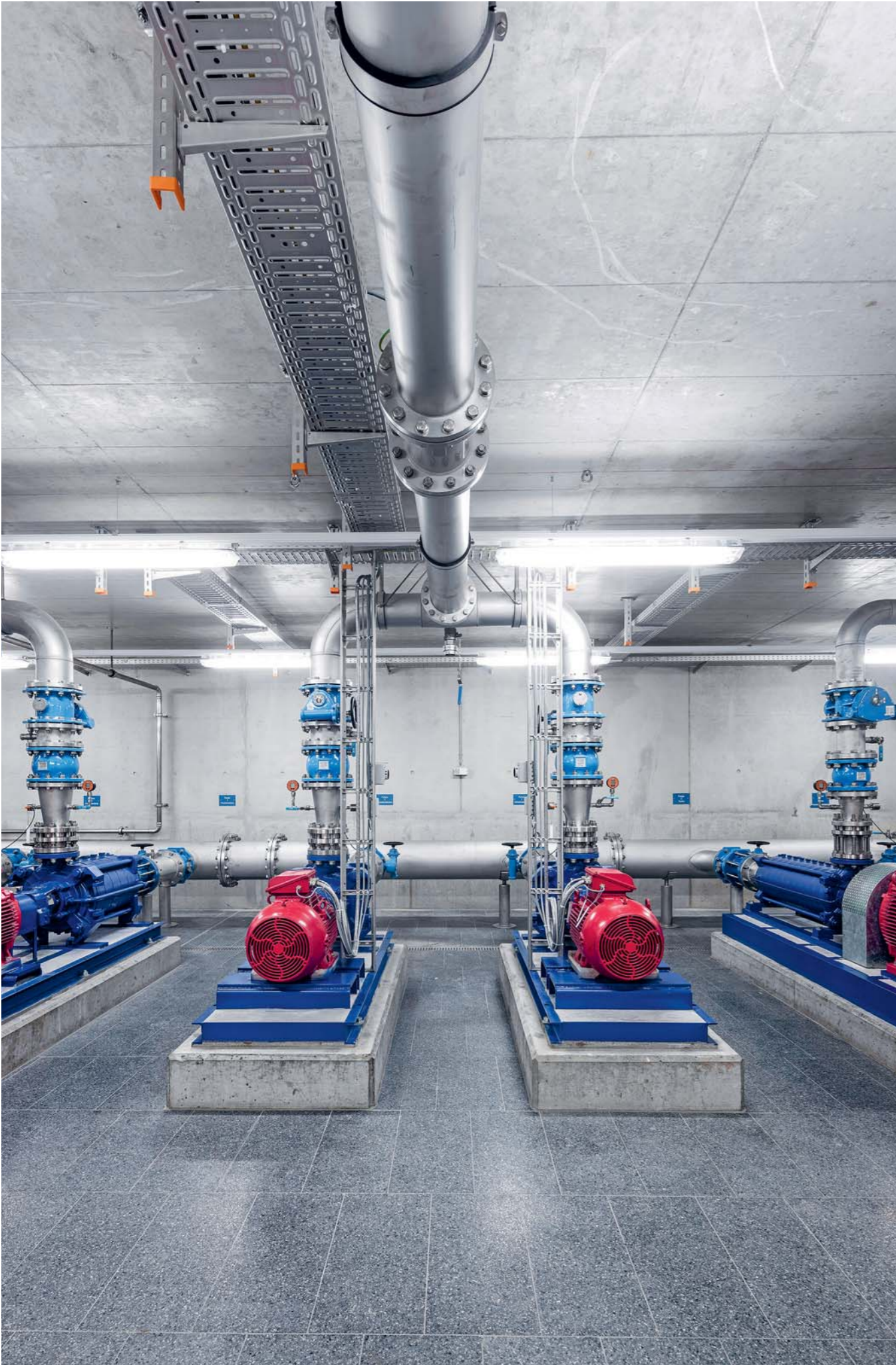
Geringe Druckschwankungen, hoher Wirkungsgrad: das Pumpsystem im Reservoir Speicherstrasse.

Das Seewasserwerk Frasnacht, wo sich auch die redundante Leitstelle befindet, läuft seit zwei Jahren mit einem neuen Fernwirk- und Leitsystem, das die gesamten Anlagen der Wasserversorgung steuert und für die Datenerfassung sowie das Reporting sowie zur Überwachung und Alarmierung verwendet wird. Fazit: Der Betreuungsaufwand und die Zahl der Störungen sind deutlich zurückgegangen. Grössere Ausfälle gab es bisher keine.