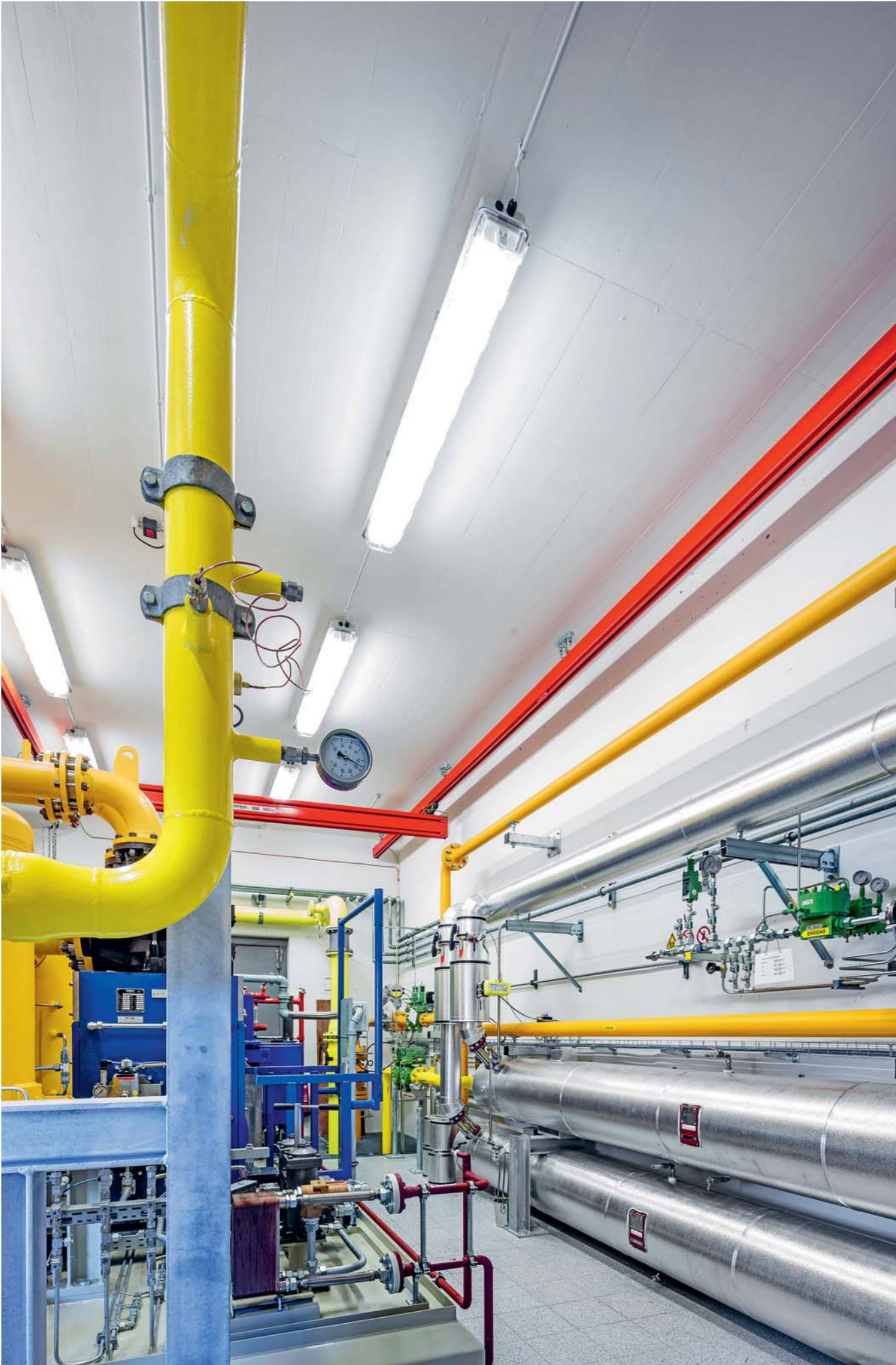
Für eine moderne Gasversorgung: die Entspannungsanlage Hohfirst.

Gas blickt in der Stadt St.Gallen auf eine lange Geschichte zurück – und in eine Zukunft, in der es auch weiterhin einen massgeblichen Beitrag an die Energieversorgung leisten wird. Die Sankt Galler Stadtwerke treiben beides voran: die Altlastenbereinigung und die Modernisierung der Anlagen.