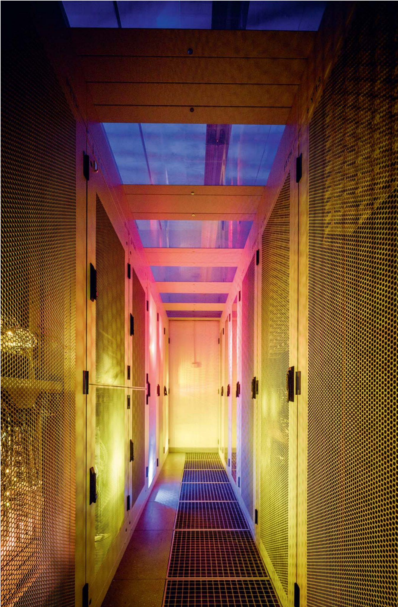
@sgsw: Die Sankt Galler Stadtwerke bauen die Infrastruktur für das Netz der Zukunft.